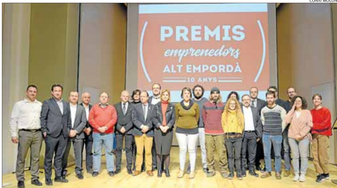
Premiats d'edicions anteriors que van explicar la seva experiència i alguns membres del jurat i organització.

Per celebrar l'aniversari, empenedors i organitzadors es van trobar, dijous de la setmana passada, a l'auditori dels Caputxins